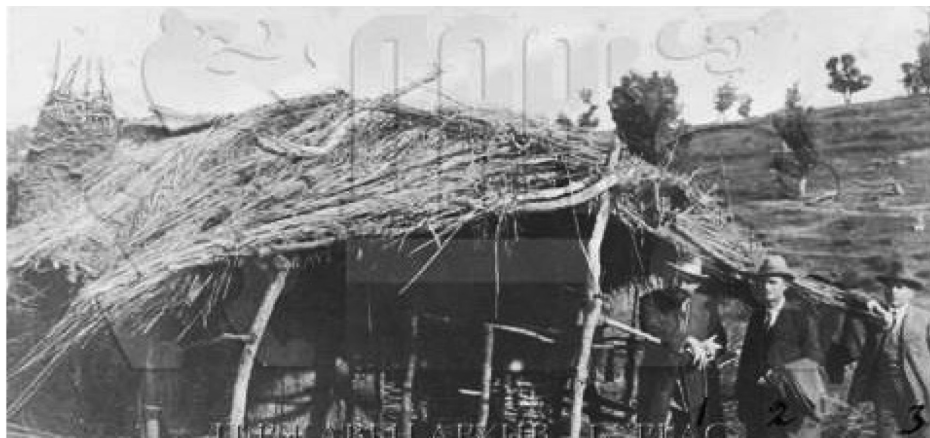
Обр. 2. Представители на международни и национални институции пред бежанско жилище в Константиново, 1925 г.