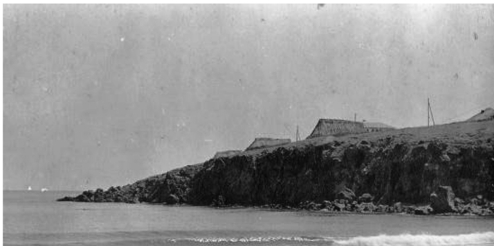
Обр. 4. Бежански жилища на п-ов Акротерион в Созопол. 33

По-различен е моделът при установяването на бежанците в Созопол. Тъй като при пристигането, през есента на 1913 г., на първите бежански групи в града, наличните тук освободени от изселилото се по това време местно гръц-