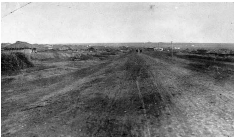
Обр. 3. Прокарване на път през Папарус.