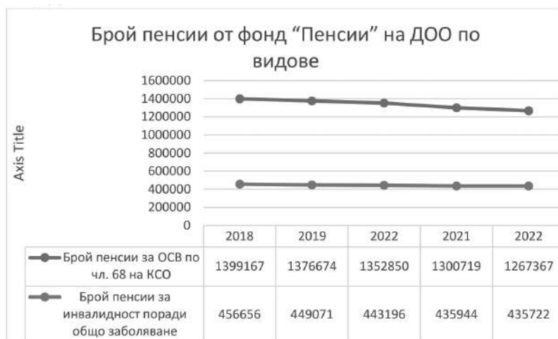
Фигура 3. Динамика на броя на пенсии за осигурителен стаж и възраст и за инвалидност поради общо заболяване

Figure 3. Dynamics of the number of old age pensions and general disability pensions