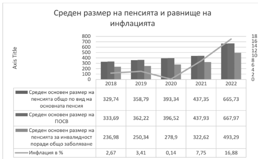
Фигура 5. Среден основен размер на пенсията (общо за всички видове пенсии, за осигурителен стаж и възраст и за инвалидност поради общо заболяване) и равнище на инфлация

Същевременно през наблюдавания период е налице трайно увеличение на размера на пенсиите, което може да бъде проследено на фиг. 5: