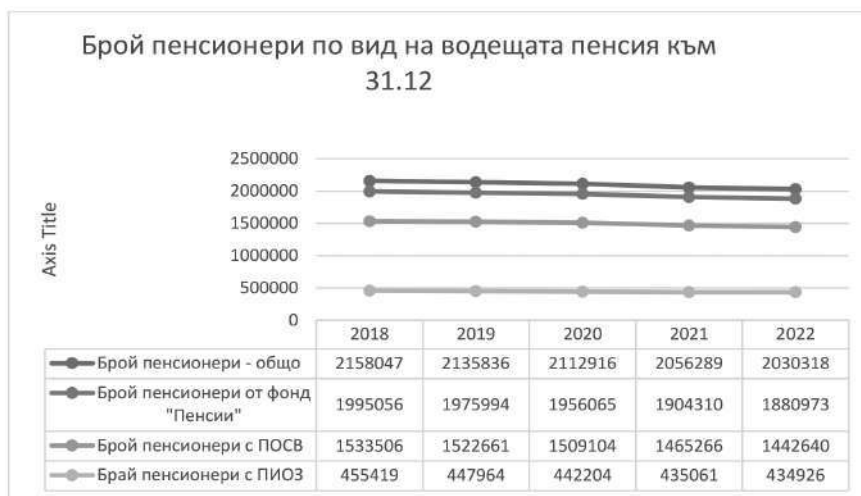
Фигура 4. Брой пенсионери към 31.12 на съответната календарна година