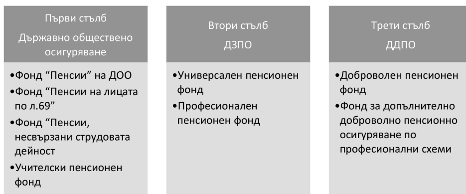
Фигура 1. Архитектура на българския пенсионен модел

Съвременният пенсионноосигурителен модел в България е тристълбов и може да бъде онагледен на фиг. 1: